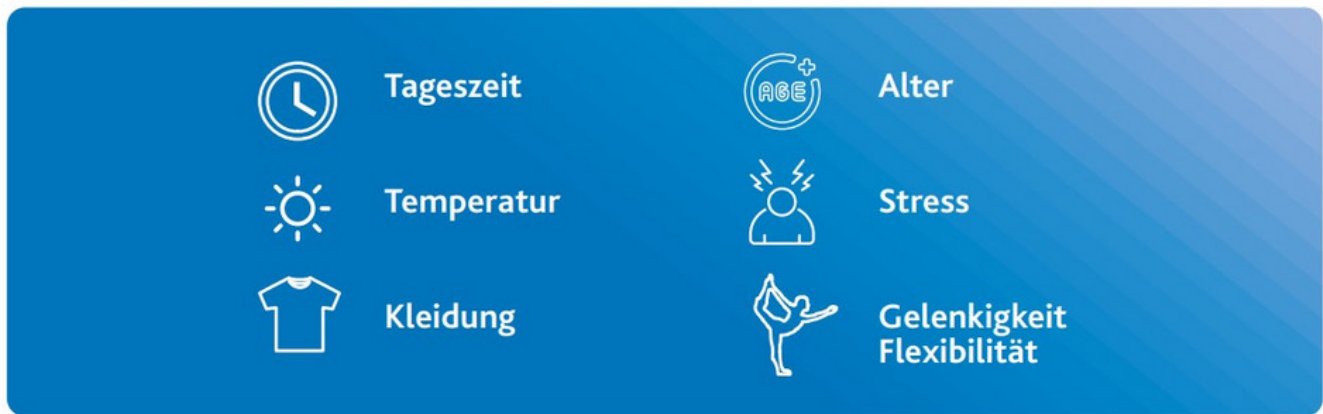
Abbildung 17: Einflussfaktoren auf die Beweglichkeit – personenexterne Faktoren (links) und personeninterne Faktoren (rechts).